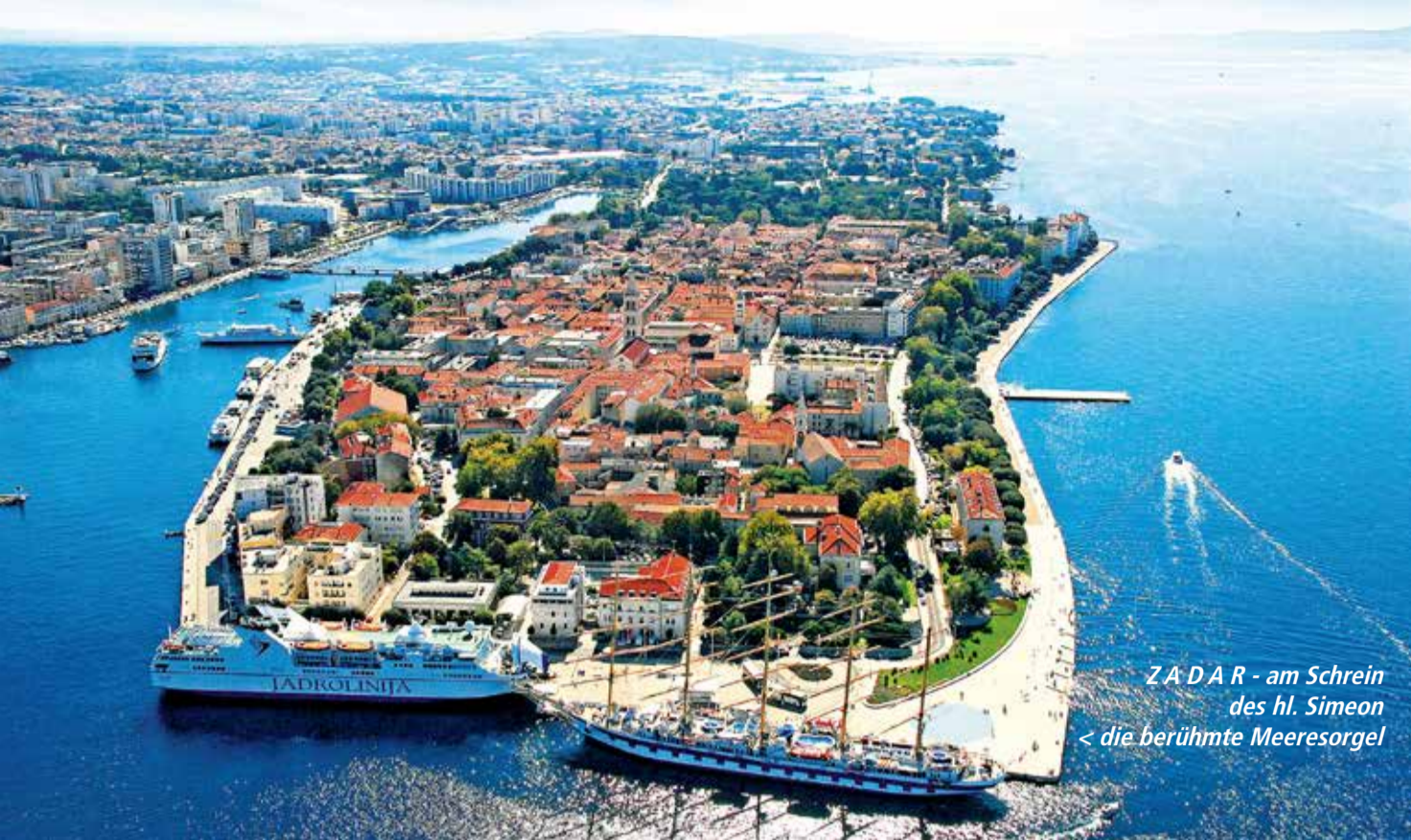
Z A D A R - am Schrein des hl. Simeon < die berühmte Meeresorgel