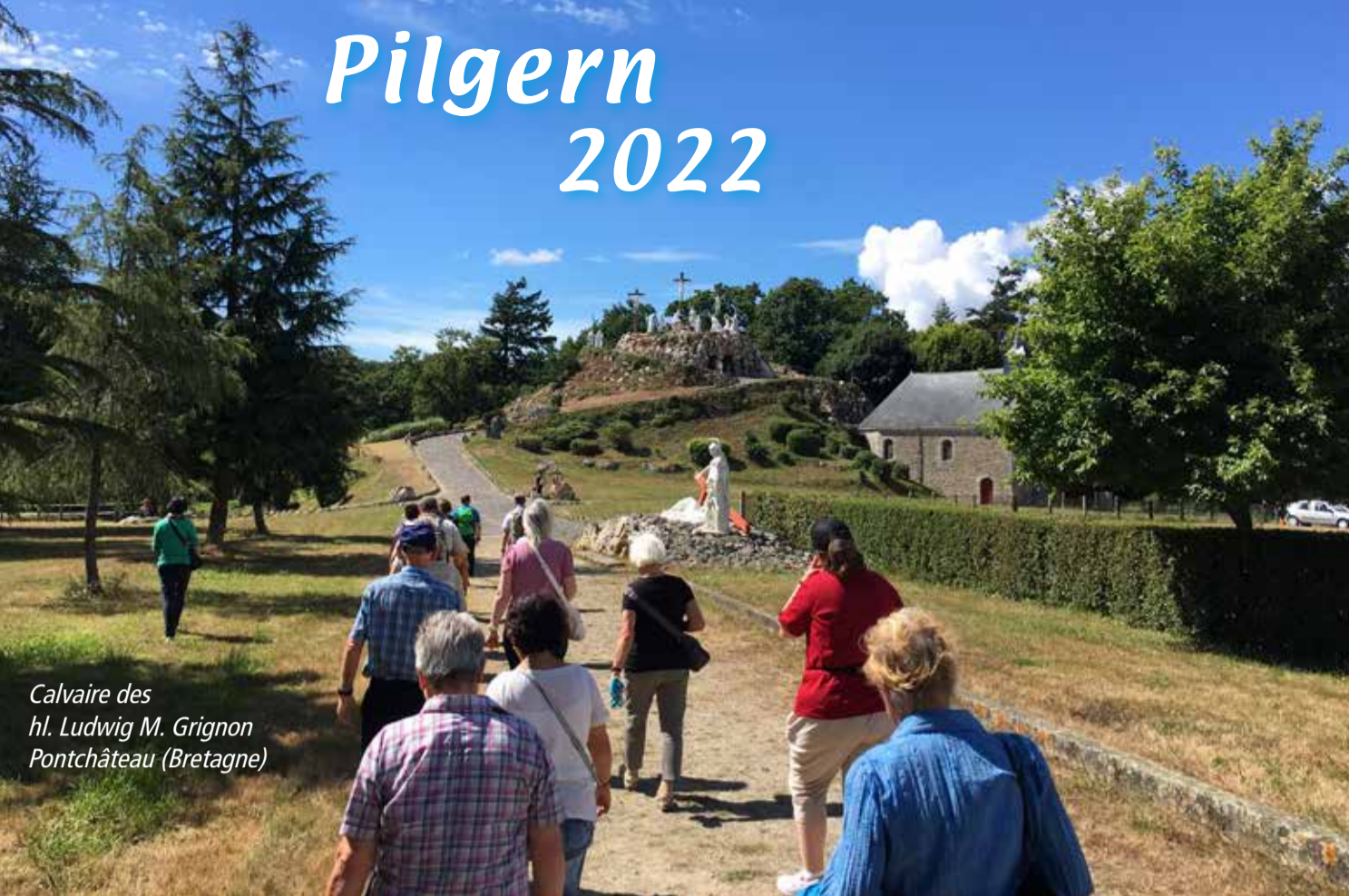
Calvaire des hl. Ludwig M. Grignon Pontchâteau (Bretagne)